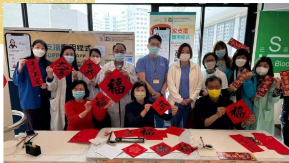
World Cancer Day Booth (New Year Fai Chun Writing) 29/1/2024 – 1/2/2024 Link