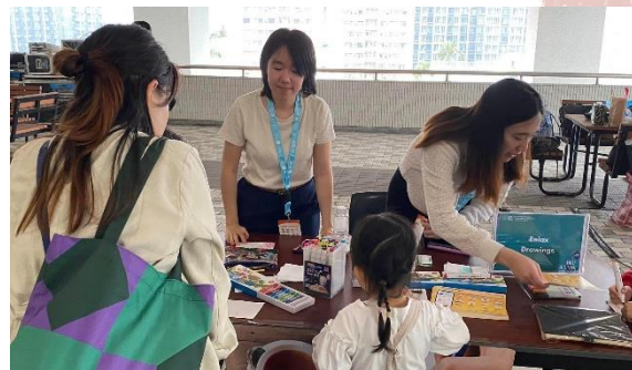
HKU Alumni Day Booth (Tea Tasting) 16/3/2024 Link