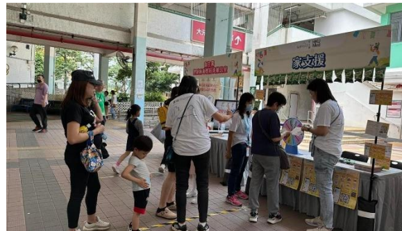
【守護你健康推廣日】 Booth 11/5/2024 Link