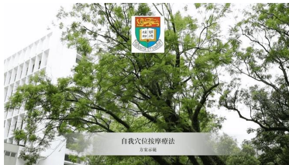
齊來減壓：自我穴位按摩療法列 (3/2024) Link