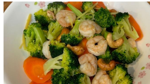
腰果紅蘿蔔蝦仁炒西蘭花 (13/4/2024, Views: 52) Link