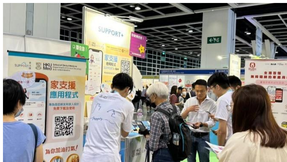
The Gerontech and Innovation Expo cum Summit (GIES) Booth 23/11/2023 – 26/11/2023