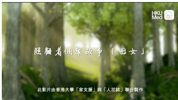
照顧者個案故事系列 (3/2024) Link