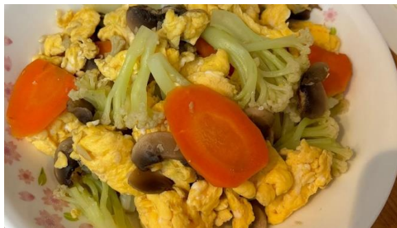
雞蛋白蘑菇蘿蔔炒椰菜花 (23/4/2024, Views: 24) Link