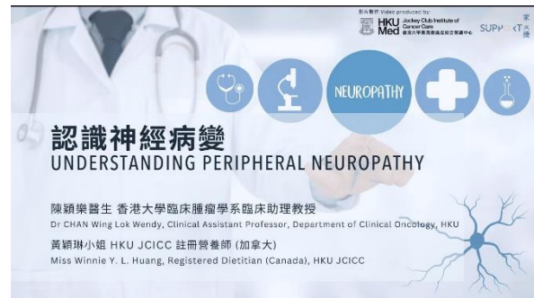
認識神經病變列 (30/5/2024) Link