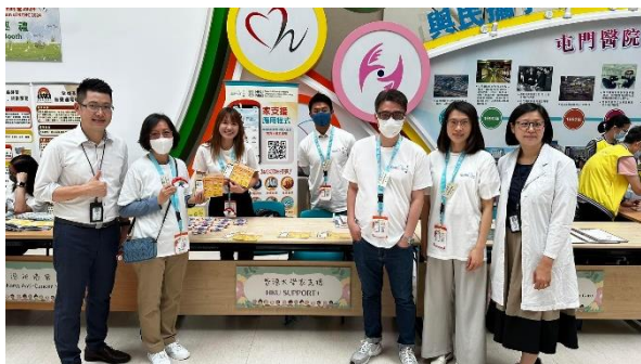
Booth at Tuen Mun Hospital 3/5/2024 Link