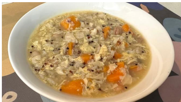
花生番薯藜麥粥 (24/4/2024, Views: 49) Link