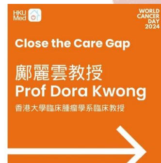
世界癌症日2024: Close the Care Gap 醫生專訪系列 (2/2024) Link