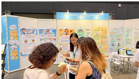
S+ Summit cum Expo 3/5/2024