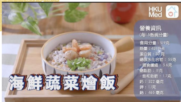
海鮮蔬菜燴飯 (7/5/2024, Views: 87) Link