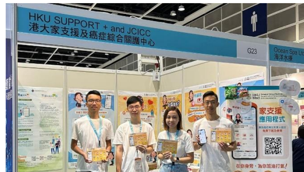
17th Health Expo 14/6/2024 – 16/6/2024