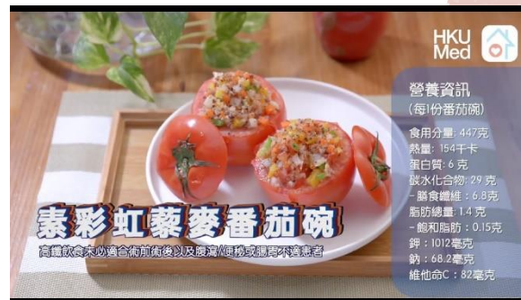
素彩虹藜麥番茄碗 (7/5/2024, Views: 77) Link