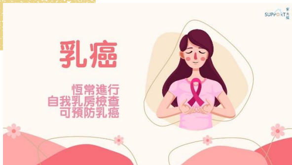
恆常進行自我乳房檢查可預防乳癌 (29/10/2023) Link